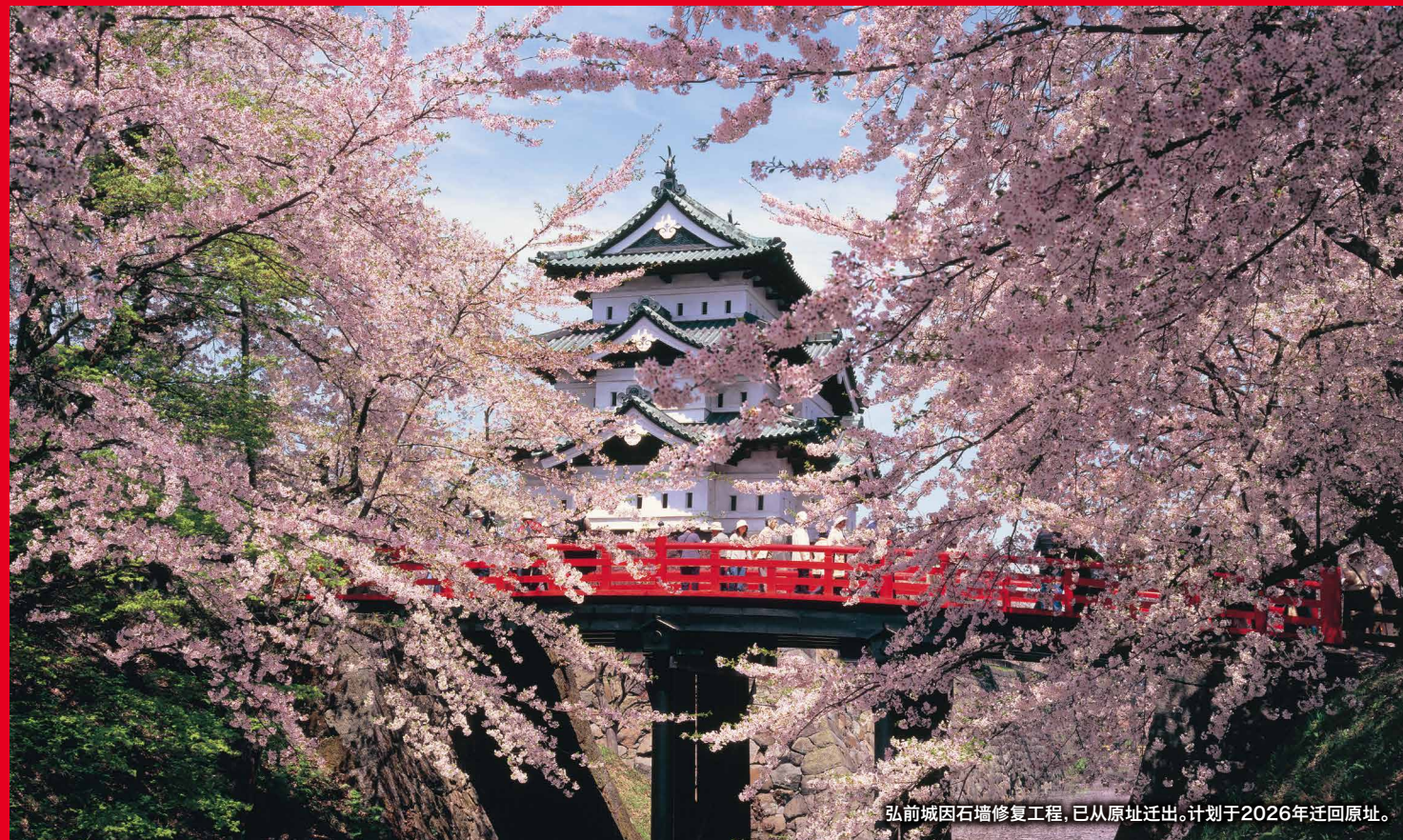
弘前城因石墙修复工程, 已从原址迁出。计划于2026年迁回原址。