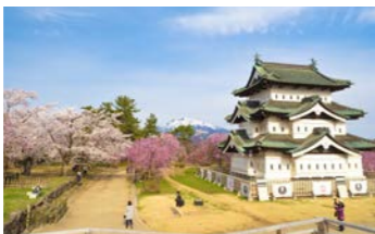
※展望台は混雑時、閉鎖になることがあります。

本丸は岩木山を一望できる絶景で知られ、中でも展望台は弘前城天守と岩木山と桜を一枚に収められる絶好の写真スポット。名峰と古城と桜が織りなす歴史口マンあふれる風景を撮影できます。