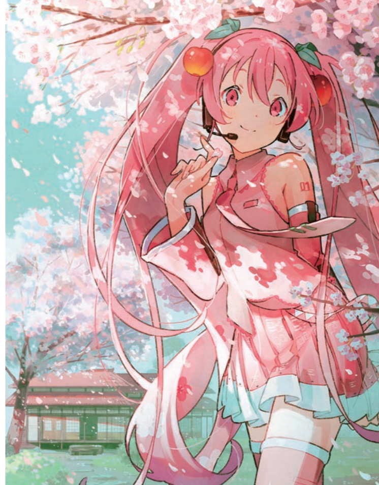
Art by 二反田こな © CFM