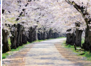
西濠沿いの「ソメイヨシノのトンネル」