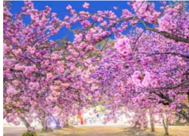
上のイラストのモチーフ「関山のトンネル」