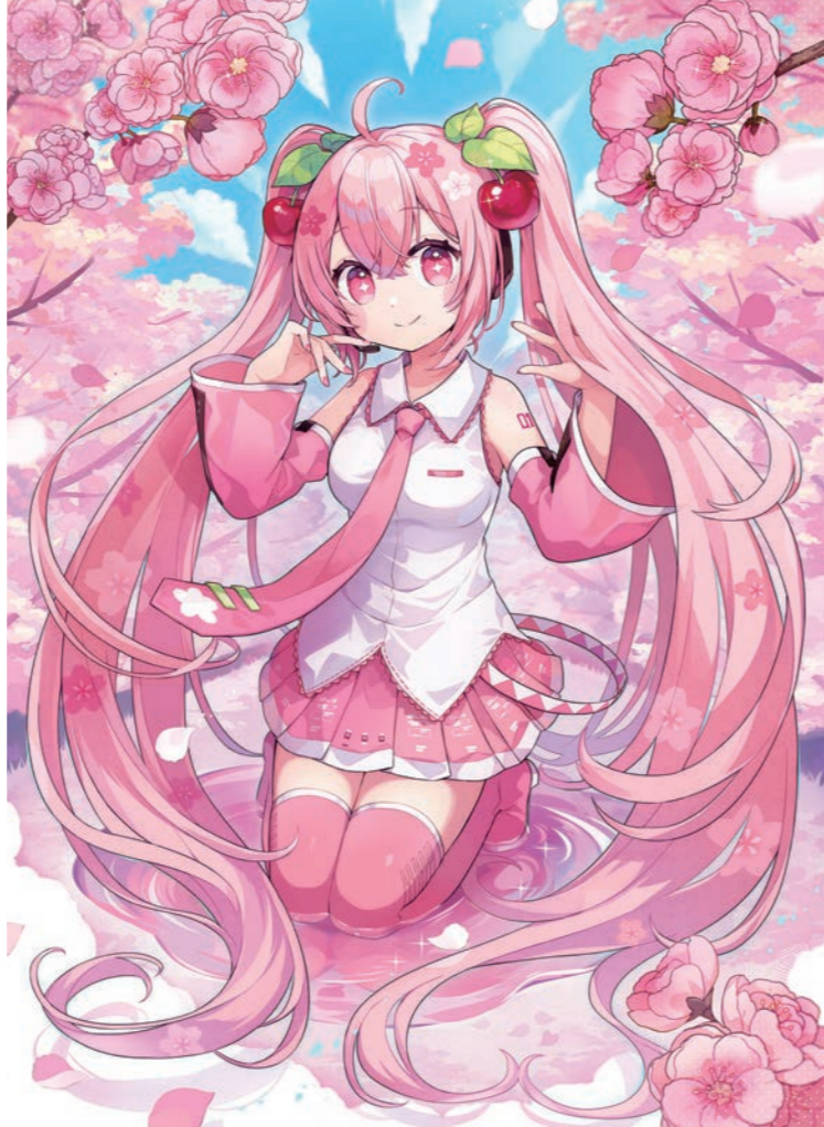
Art by ちよん* © CFM