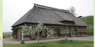
旧小山内家住宅 弘前市高杉に建てられた江戸時代の農家住宅を移築し、古い農機具の展示や、りんご生産の先駆者も紹介しています。