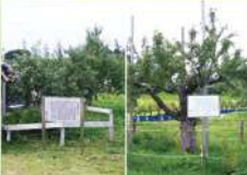
2 「ふじ」・「金星」準原木 故 齊藤昌美が昭和33年(1958)に、「ふじ」の原木の穂木を譲り受け、接いだうちの1本です。また、ふじの準原木の横には弘前市発祥の「金星」の準原木もあります。