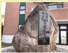
3 弘前市・斜里町友好記念碑 文化4年(1807)に津軽藩士100余名が北海道に派遣されましたが、越冬中の厳しい寒さと栄養不良により72名が現斜里町で亡くなりました。斜里町では、昭和48年(1973)に津軽藩士殉難慰霊の碑が建てられ、慰霊祭が毎年行われています。昭和58年(1983)に斜里町と弘前市が友好都市の提携を結び、その30周年を記念した友好記念碑が平成25年(2013)に建てられました。