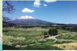
すり鉢山からの風景 すり鉢山から望むりんご園と岩木山。