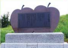
5 リンゴ追分歌碑 昭和27年(1952)に弘前市などで、美空ひばり主演映画「りんご園の少女」が撮影された記念の歌碑です。