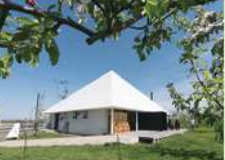
1 弘前シールド工房 kimori りんご畑に囲まれた白い三角屋根の醸造所です。工場見学や有料でシールドの試飲(要予約)もできます。電話/0172-88-8936 ◎9:00~17:00 水曜定休