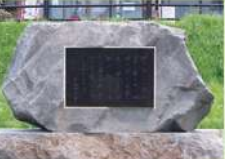
4 石坂洋次郎文学碑 弘前市出身の小説家・石坂洋次郎の「わが日わが夢」の中で、本人が一番好きなあとがきにある名文を石碑に直筆で刻んだものです。「物は乏しいが空は青く雪は白く林檎は赤く、女達は美しい園それが津軽だ。私の日はそこで過れば、私の夢はそこで育かれました。」本人の希望により、りんご公園に建碑されました。