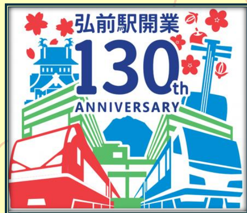
JR弘前駅開業130周年記念ロゴマーク

※一部イベントは終了時間が異なります ※悪天候の場合は、一部のイベントを中止する場合があります